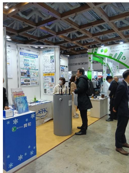
展示ブースの様子