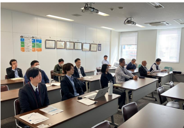
会議室で参加する受験対象者や指導者