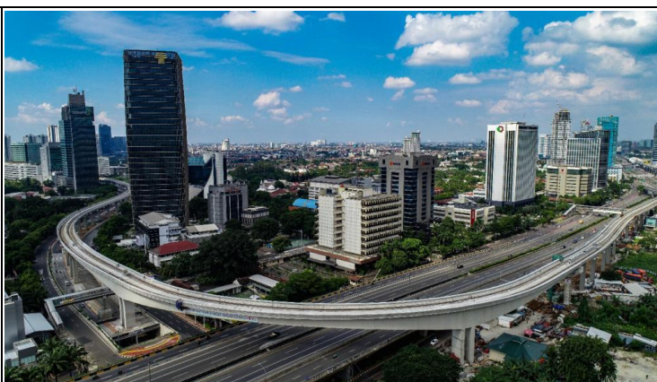
受賞プロジェクト 西ジャワ州ジャカルタ首都圏 LRT 建設施工監理コンサルティングサービス (インドネシア)