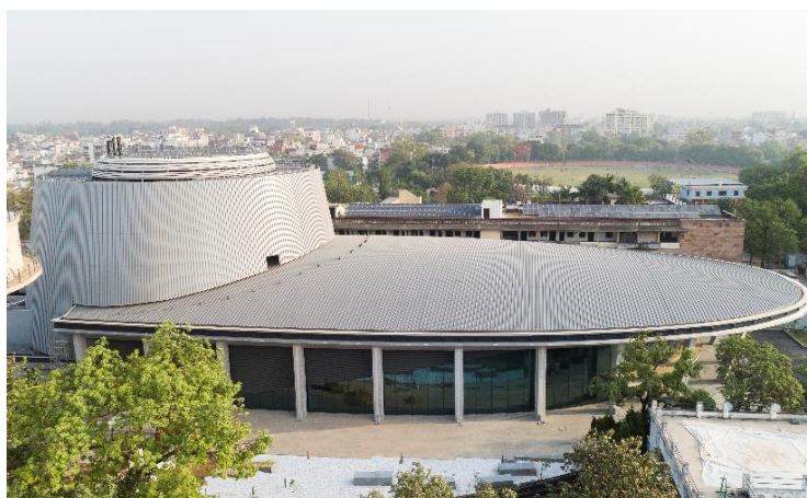
受賞プロジェクト バラナシ国際協力コンベンションセンター建設事業 (インド)