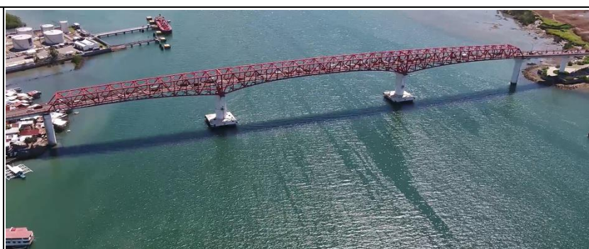
受賞プロジェクト 新マクタン橋建設事業準備調査および詳細設計調査フェーズⅡ (フィリピン)

本認定・表彰は今後の海外進出や国内外の技術者の相互活用を促進するため、海外インフラプロジェクトに従事した本邦企業の技術者の実績を認定し、特に優秀な者について表彰するものです。