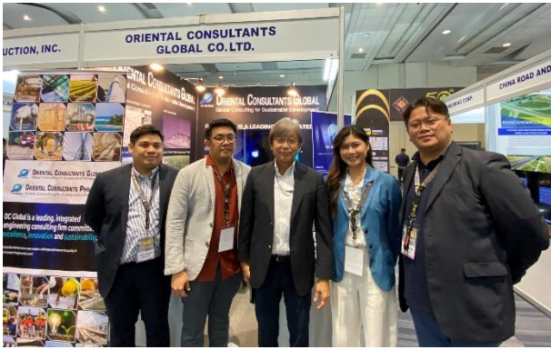
ブース前 OC Global 社員記念撮影