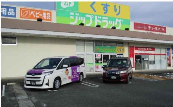
デマンド交通の車両 (左から チョイソコめいひめ、でん多)

（株）オリエンタルコンサルタンツは、実証事業の企画準備や効果分析を行い、本事業の実装に向けて取り組んでまいります。