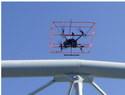
ガードドローン（水管橋点検）

名 称 : 建設技術展 2024 関東 (C-Xross2024) 主 催 : 日刊建設工業新聞社 開催日時 : 2024年11月13日（水）～11月14日（木） 会 場 : サンシャインシティ 3F 展示ホール D（東京都豊島区東池袋 3-1-4） ブースナンバー「2階 D ホール D-12」