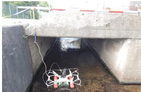
水面ドローン（溝橋点検等）