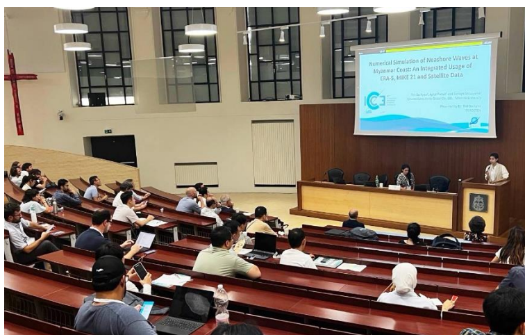
Thit さんによる論文発表

【関連リンク】第38回国際海岸工学会議 (ICCE 2024 ROME) 公式サイト https://icce2024.com/