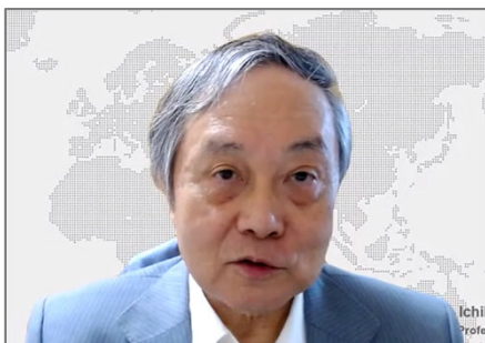
開会挨拶：市川宏雄 日本危機管理防災学会会長