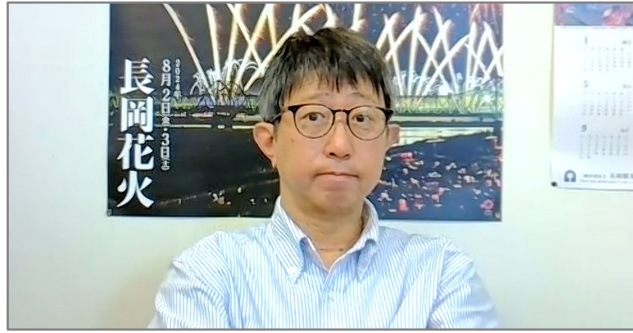
【基調講演】高見真二 新潟県長岡市役所 副市長