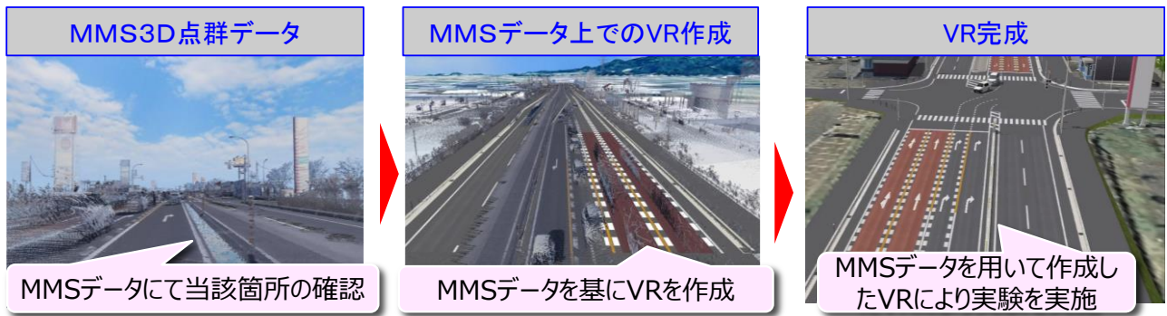
図1 MMS3D 点群データを活用したVRの作成