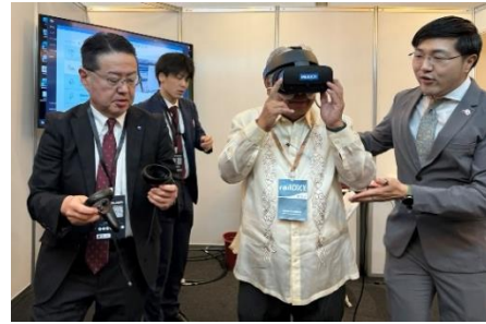
バウティスタ運輸大臣も VR を体験

同社は、フィリピン国の鉄道事業における業務拡大を受け 2019 年 6 月に「フィリピン鉄道事業統括室」を設置したほか、都市鉄道の運営・保守に関するコンサルティング業務を強化するため 2020 年 4 月に「O&M 推進室」を、また、同時に BIM/CIM 技術の開発・活用強化を目的として「BIM/CIM 推進室」を設置し、特にフィリピン鉄道事業での BIM/CIM 技術の活用を推進しています。今後もフィリピン鉄道整備事業を推進するとともに、人材育成・能力強化を通じて同国都市鉄道システムの安全・安心かつ効率的な運行を支援していきます。