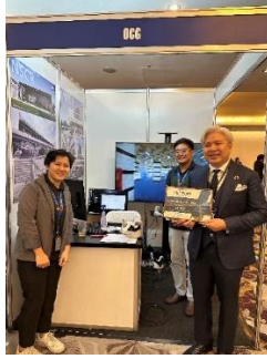
同社 VR 体験ブース