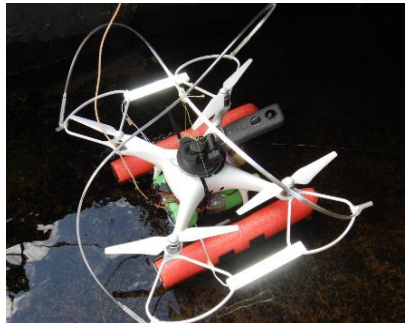
水面ドローン (溝橋点検等)