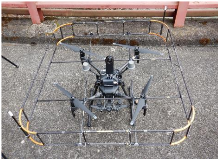
ガードドローン (水管橋点検等)