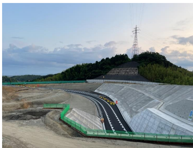
写真-1:形状変更が完工した出口ランプ