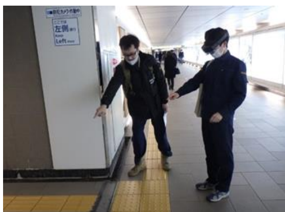
現地テストの様子

今後も同社は、デジタル技術の活用を推進し、鉄道の安全運行に貢献できるように尽力してまいります。