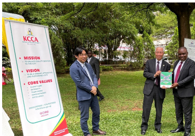
交通安全戦略ペーパーとともに 左：内山貴之所長、中央：福澤秀元大使 右：Erias Lukwago 市長