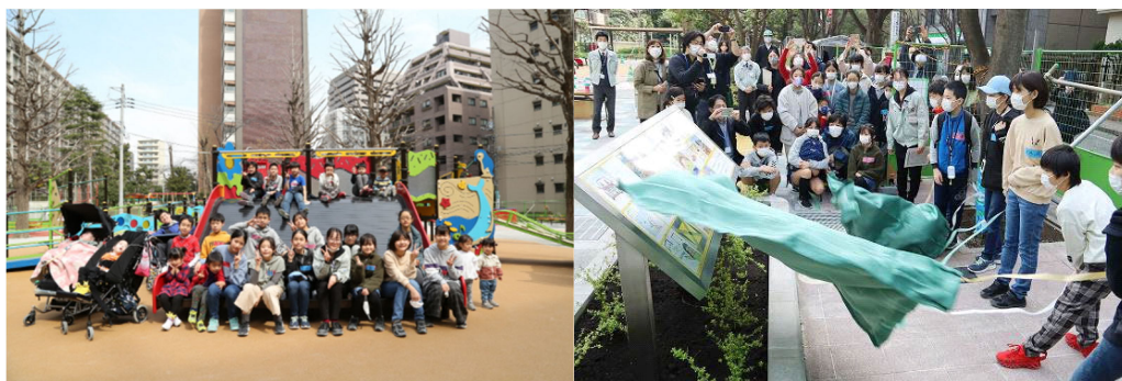
公園お披露目会のようす（左：集合写真、右：モニュメント除幕式）

基本構想段階では、区内の小学生を対象としたワークショップ、児童発達支援事業所や特別支援学校の方々へのアンケート及びヒアリングを実施し、設計段階では公園利用者に対するヒアリングを行う等、実際の公園利用者のアイデアや声を公園整備に反映することに視点をおき検討してきました。構想、設計、工事それぞれの段階で得られた知見等を活用し、今後もインクルーシブな空間づくりを推進し、障害の有無にかかわらず様々な方たちが共に学び遊べる場の創出、共生社会づくり、誰もが自分らしく輝くことができるダイバーシティの実現を進めていきます。