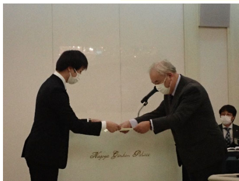
表彰状授与の様様