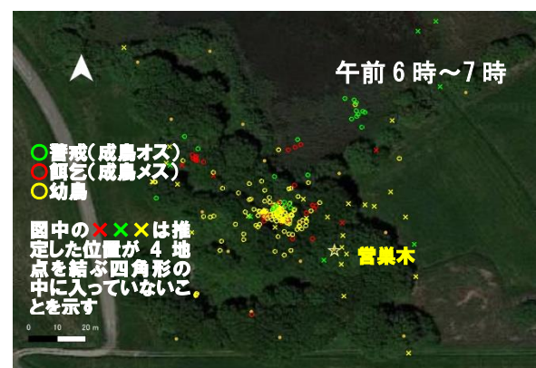
音声レーダーで推定したオオタカの位置

今後、国、自治体、民間等で実施する猛禽類調査において、本技術の活用を提案し、効率的、効果的な調査の実施に繋げていく予定です。