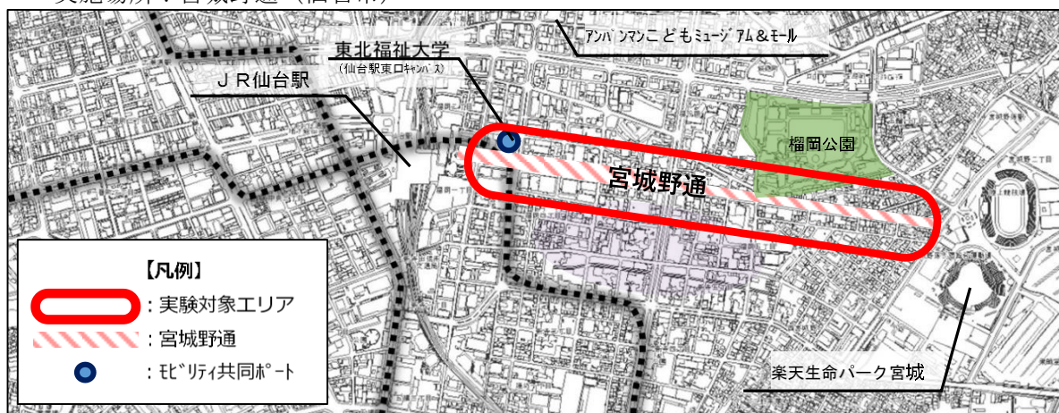
表 社会実験の実施内容