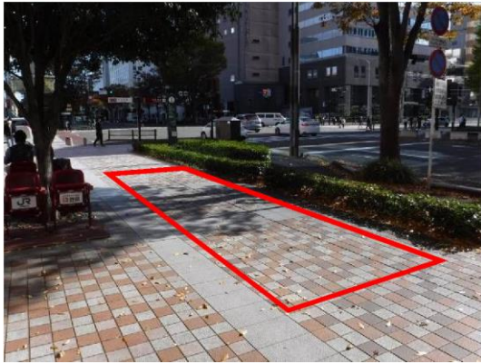
宮城野通（東北福祉大学前）の現状