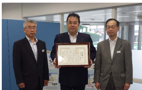
賞状を受領する百岡(株)アサノ大成基礎エンジニアリング 盛岡事務所所長(写真中央)

これからも同社は、長年培った技術やノウハウを活用しながら、確かな技術で社会づくりに貢献できるよう尽力してまいります。