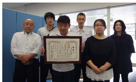
集合写真(同社盛岡事務所 落石チーム)