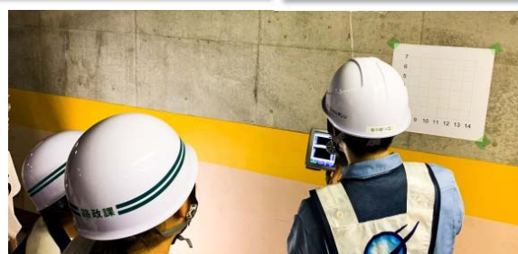
鉄筋探査機による鉄筋位置及び被り調査

同社は、これからも学生等の職場体験などを支援して、インフラ施設の重要性をわかりやすく伝え「未来の担い手」育成に貢献して参ります。