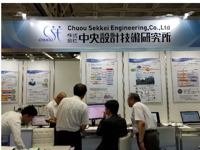
システムデモの様子