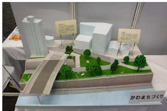
出展内容①水辺周辺のデザイン検討展示物