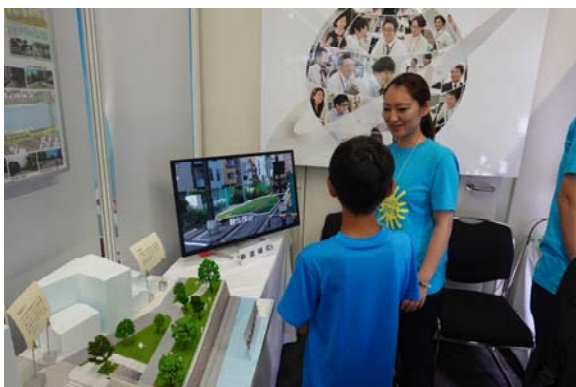
出展内容①かわまちづくり説明風景