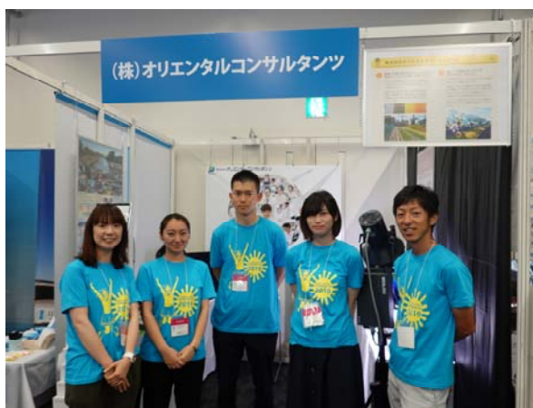
出展に参加した同社社員