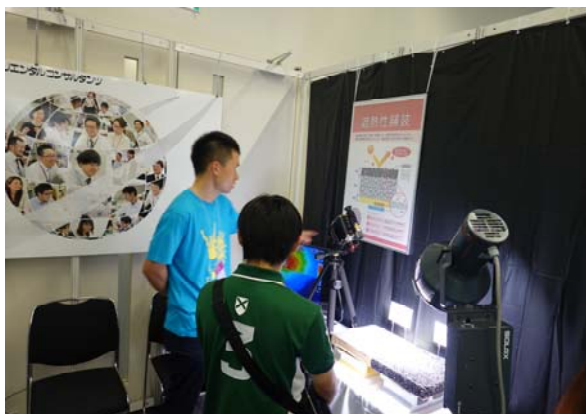
出展内容②遮熱性舗装比較説明風景