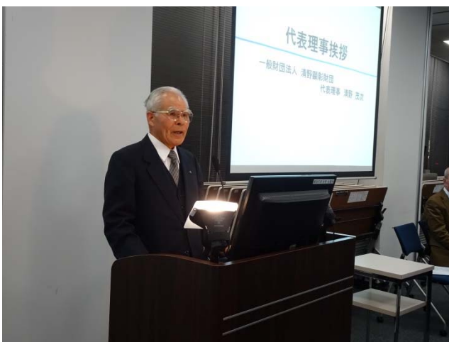
第 1 回清野賞表彰式の様子

当社グループでは、当財団の趣旨に賛同し、事業を支援するとともに、今後も、次世代に向けた新たなビジネスモデルの構築や新技術の開発を積極的に推進できる人材を育成することで、新たな社会価値の創造に取り組んで参ります。