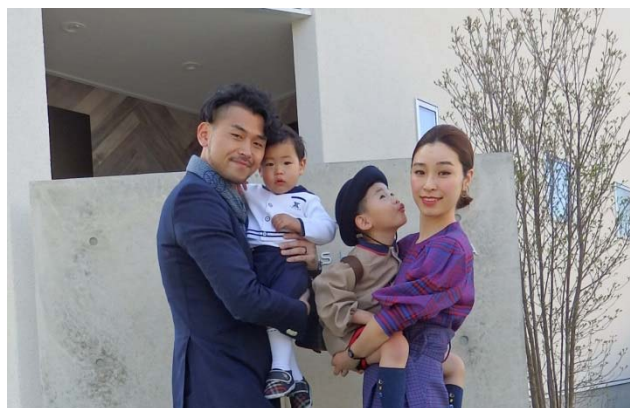
【写真】(左)「育児をしながら管理技術者として活躍する社員の体験談」発表者(中央)と Smile-3S メンバー (右)「夫婦共働きで育児に従事する社員の体験談」発表者(左)とご家族

＜本資料に関するお問い合わせ先＞ 株式会社オリエントタルコンサルタンツ TEL: 03-6311-7551 FAX: 03-6311-8011 URL: http://www.oriconsul.com/ 統括本部 宮内、内藤