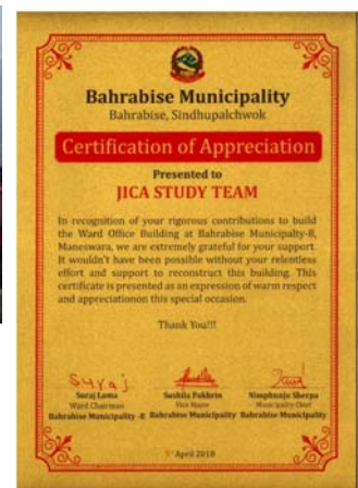
事務所の引き渡し先である Bahrabise 市からの感謝状