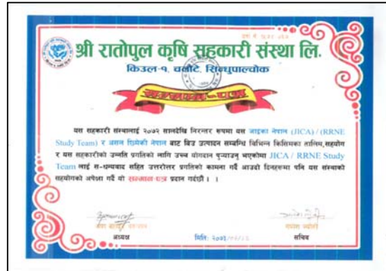
優良種子生産の技術指導を行った Ratopool Krishi Sahakari Samstha Ltd. からの感謝状