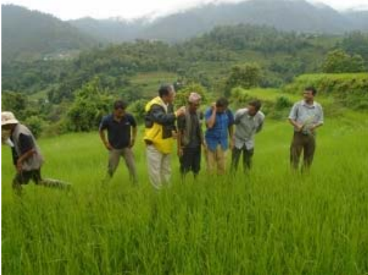
水稲などの優良種子生産の技術指導を実施

地震により倒壊した種子貯蔵庫を再建するとともに、優良な種子を生産するための技術指導を行い、ハード・ソフト両面からの支援を実施いたしました。