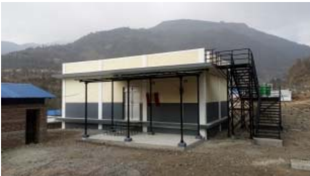
再建された種子貯蔵庫 (2018年2月)