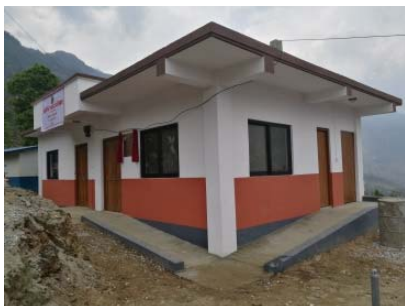
再建された Maneshwara 村開発委員 引き渡し式 会事務所（2018 年 4 月）

地震により倒壊した Maneshwara 村開発委員会の活動施設を早急に再建いたしました。本施設の完成により、地域住民の各種登録や書類発行等の業務が正常に実施されるようになることが期待されています。