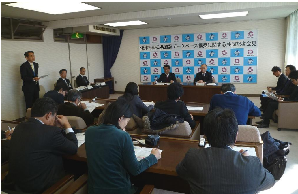
共同研究の成果に関する記者発表の様子