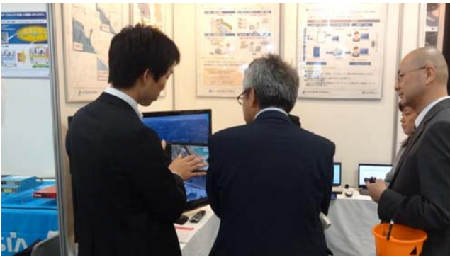
タブレット端末を使った説明